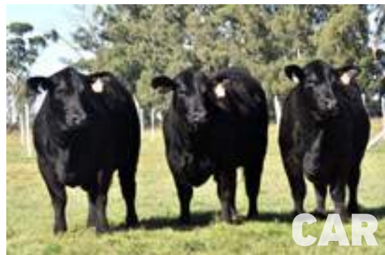
Hijas de Carandá.