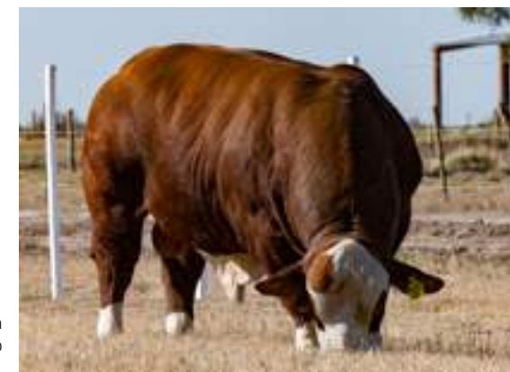
Moderación y biotipo carnícano.