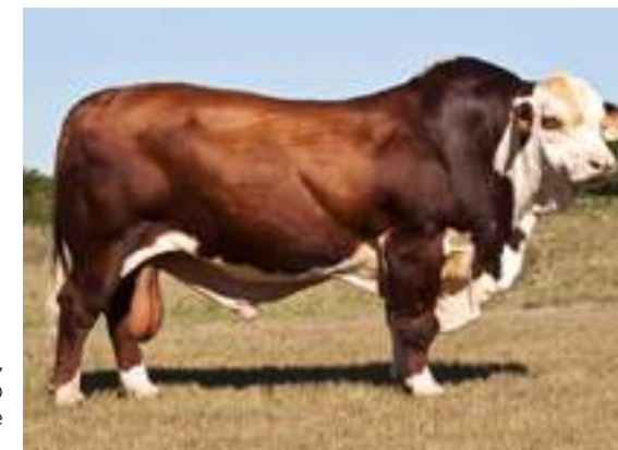
Corchito, abuelo materno de Juramento.