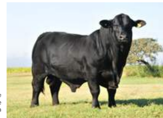
Excelente frente de Etiqueta Negra.