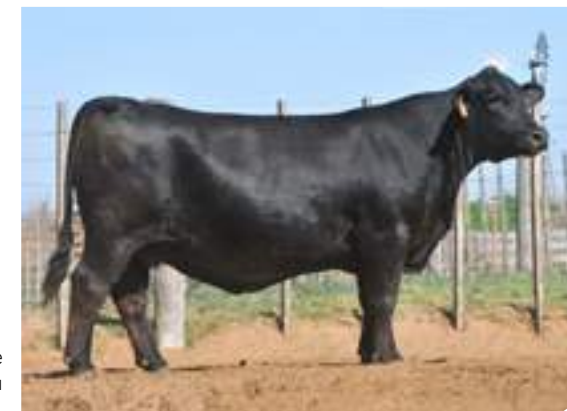
La donante RP 9606, su madre.