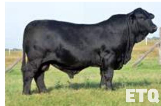
RP 13757, hijo de Etiqueta Negra.