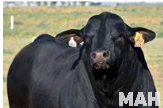
RP 14589, destacado hijo de Mahuida.