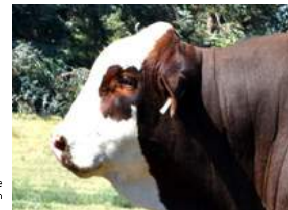
Excelente pigmentación ocular..