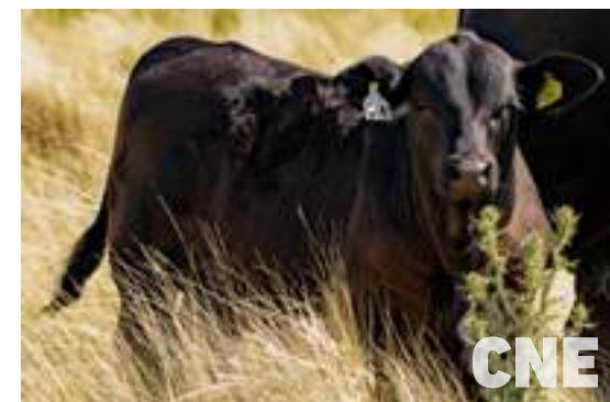
Hija de Cerro Negro.