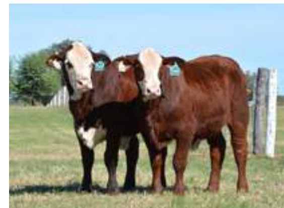
Progenie muy pareja en nuestros rodeos.