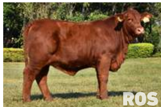
RP 604, hija de Rosendo de Arandú, PY.