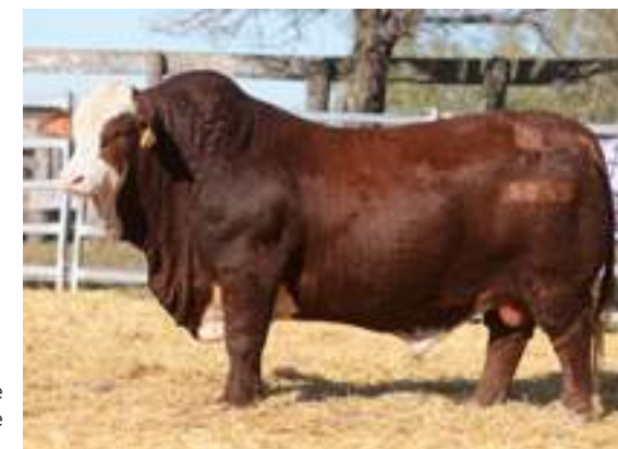
Excelente grado de acebuzamiento.