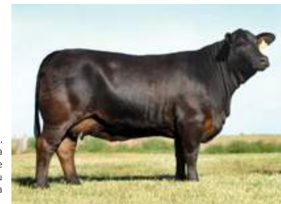
J2, destacada donante como su abuela materna.