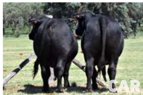
Destacados hijos de Carandá.