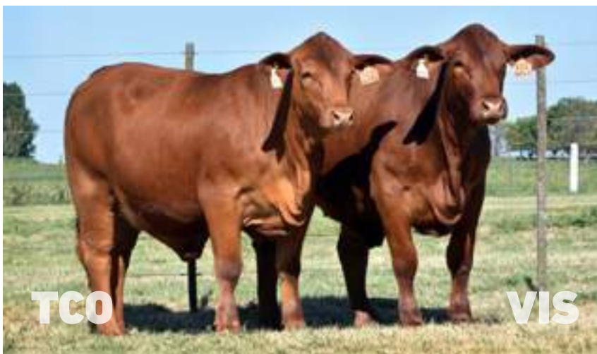
Hijas de Tabasco y Visionario, mostrando toda la clase en Brangus Colorado.