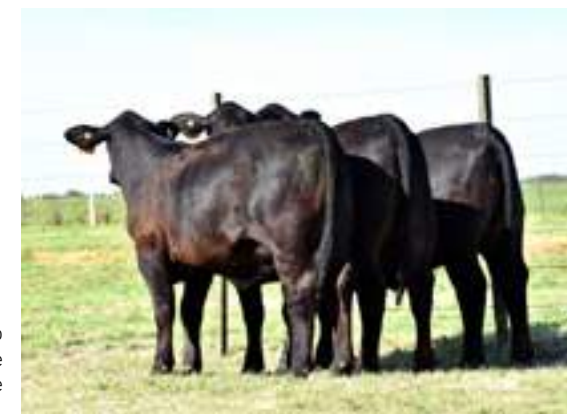
Destacado trío de hijas de Payanquén.