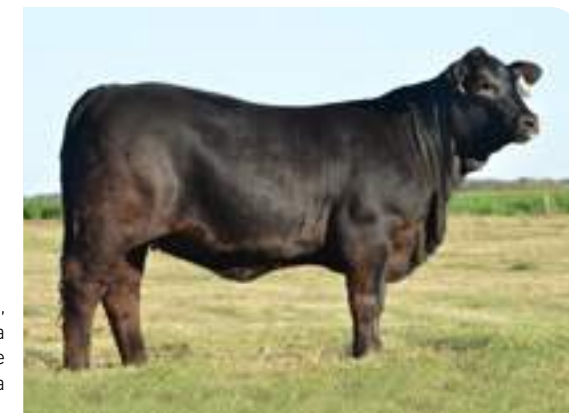
RP 12158, destacada hija de Etiqueta Negra.