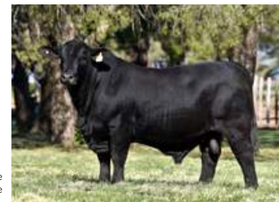
Carló, impone su actitud de padre.