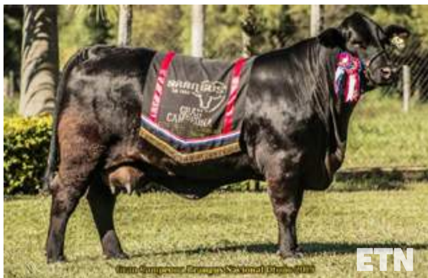
Gran Campeona Hembra Nacional 2019, de Santo Domingo PY.