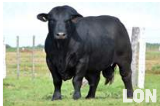
Pehuén, toro padre hijo del consagrado Lonquimay.