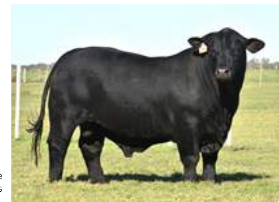
Gran balance en todas sus líneas.