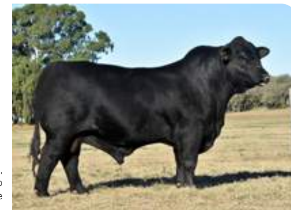
RP 14545, destacado hijo de Carandá.