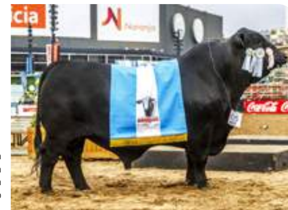
Payanquén como Gran Campeón de Palermo 2017.