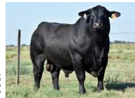
RP 14589, fiel reflejo de Mahuida en este soberbio hijo.