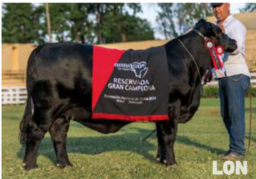
Reservada GCH Nacional 2018, Paraguay. Hija de Lonquimay.