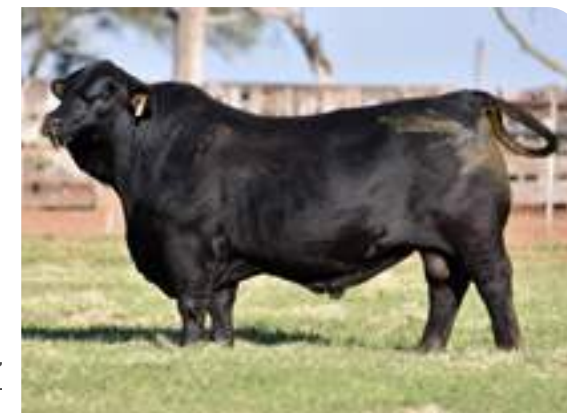
Cerro Negro, en la cabaña. Abril 2020.