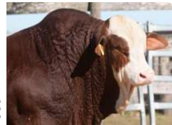
Anteojeras bien definidas en Fortachón.