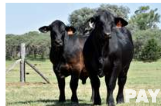
Destacados hijos de Payanquén.