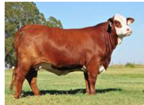
Margarita, hermana entera de Metán.