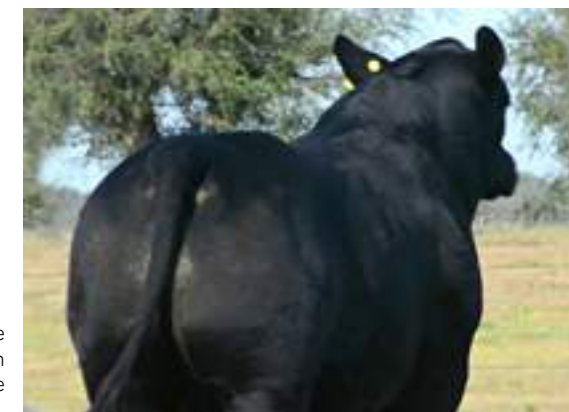
Mucha carne en el tren posterior de Carandá.