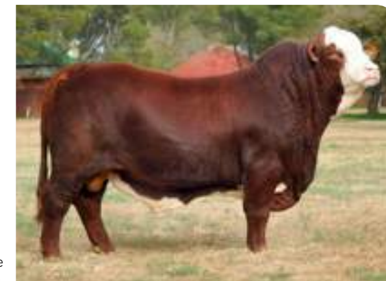
Metán, padre de Esteco.