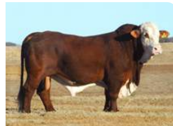
Salteño su padre a los dos años de edad.