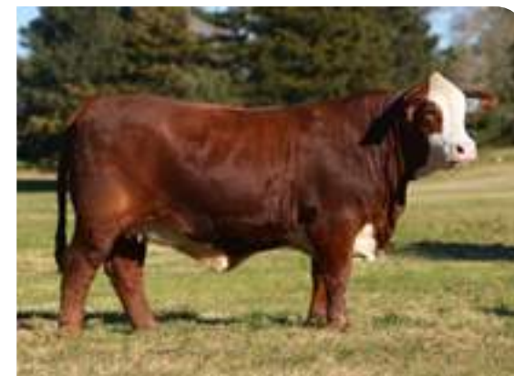
RP 4818, hija de Metán que fuera cabeza de remate en Resistencia 2017.