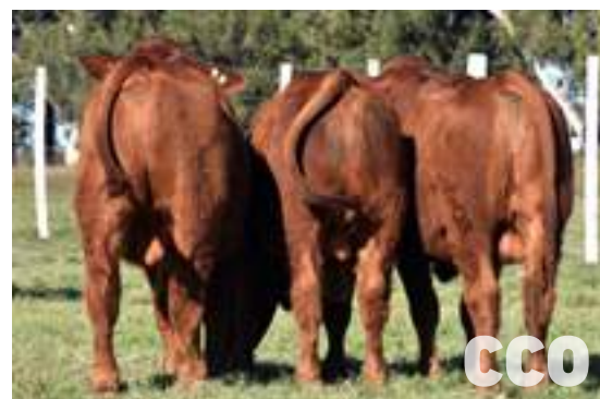
Hijos de Cerro Colorado.