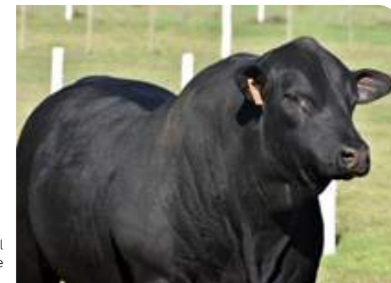
Biotipo ideal para lo que busca la raza.