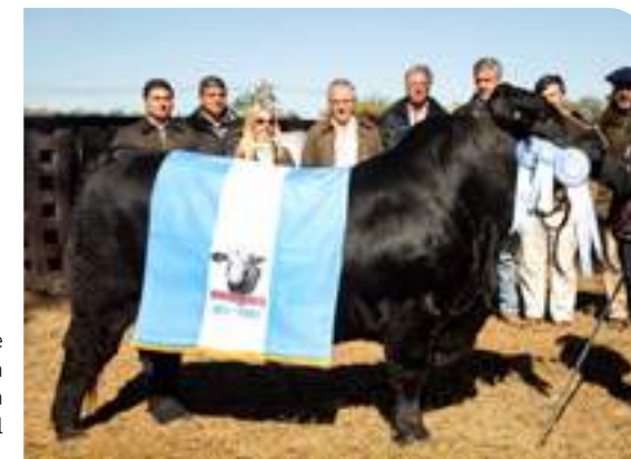
Lambaré como Gran Campeón Nacional 2018.