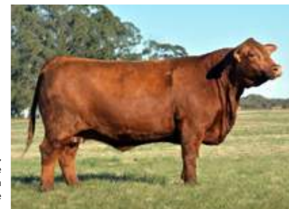
K752, donante colorada madre de Lambaré.