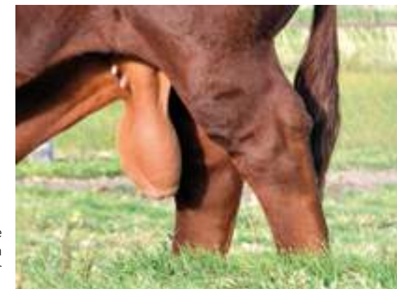
Excelente conformación testicular y CE.