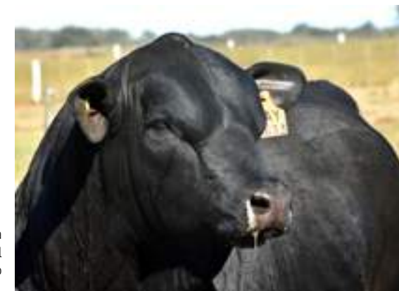
Sobrada calidad racial en Cerro Negro.