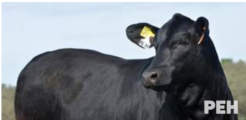
RP 12878, hija de Pehuén y nieta de Lonquimay. Consistencia genética