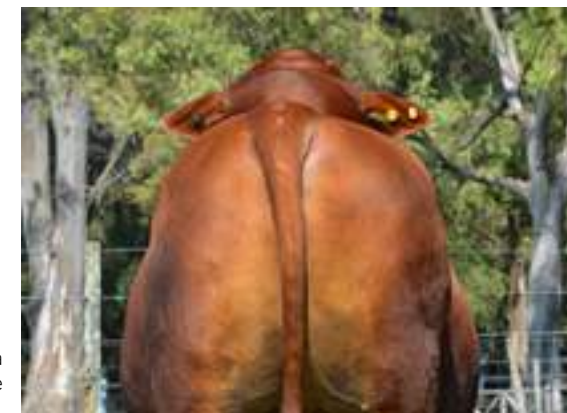
Tremenda culata de Tabasco.