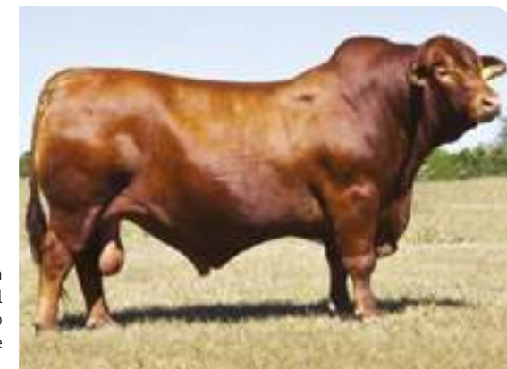
Don Ciriaco, el consolidado padre de Tabasco.