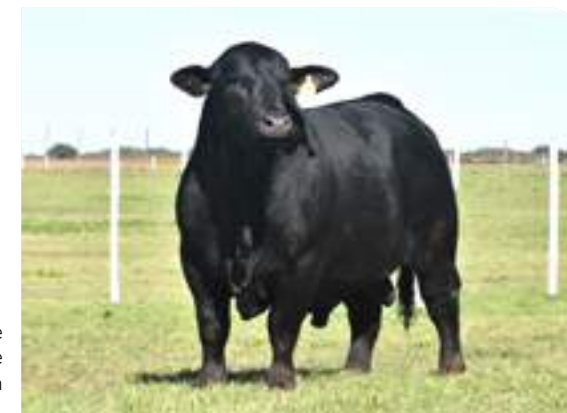
Imponente en su frente y gran estructura.