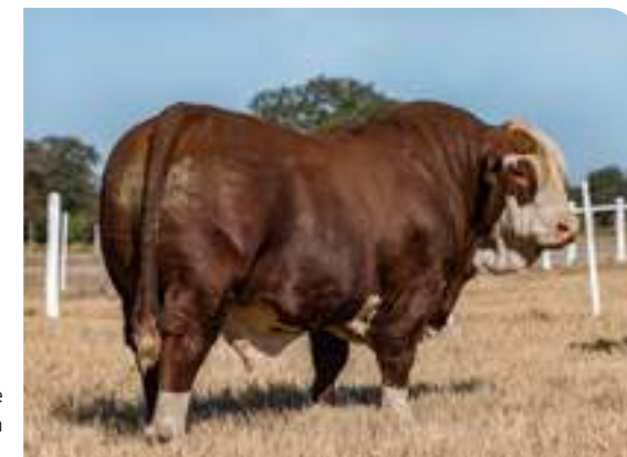
Imponente culata en Paiubre.