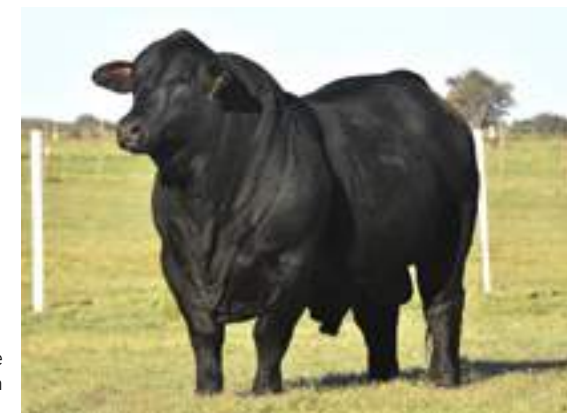
Relmó posee una actitud bien masculina.