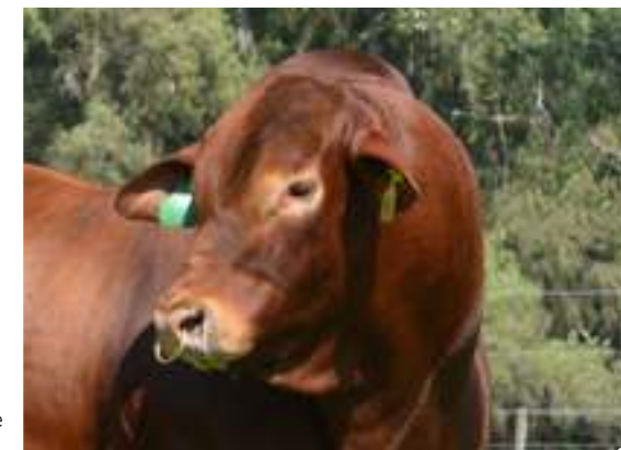
Alto grado de acebuzamiento.