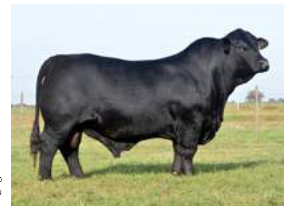
El probado Carandá, su padre.