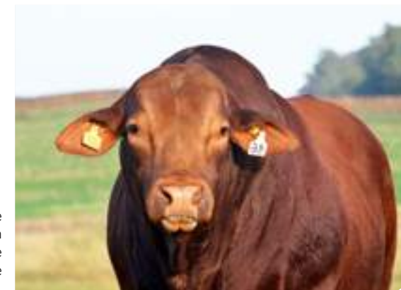
Impactante volumen en el frente y lomo de Visionario.