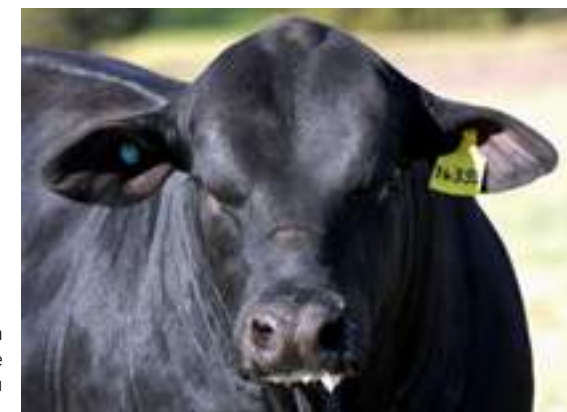
Soberbia actitud de padre en su frente.