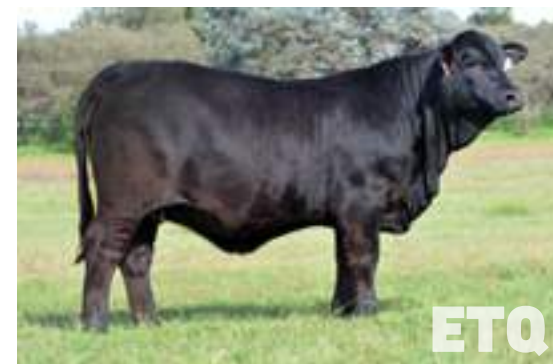
RP 12916, hija de Etiqueta Negra.