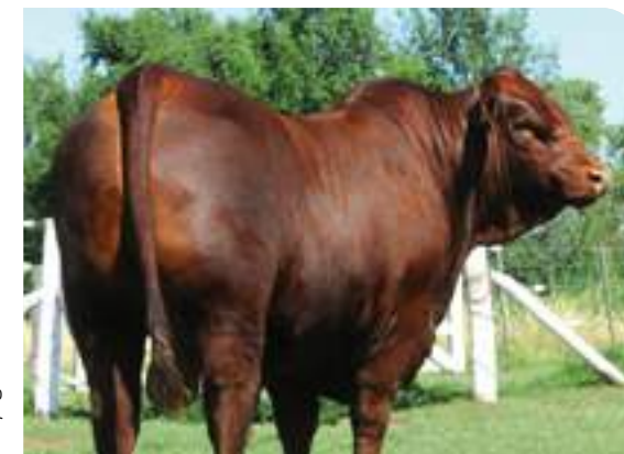
Tremendo tren posterior de Rosendo.