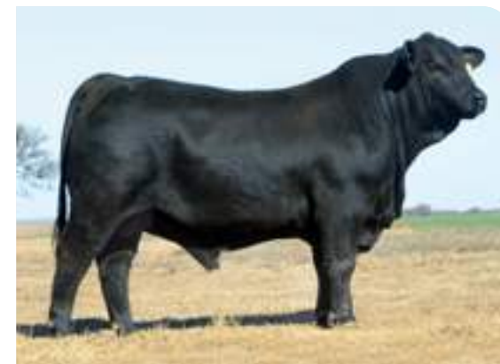
Tsonga, de ternero. GCM Ternero Nacional.