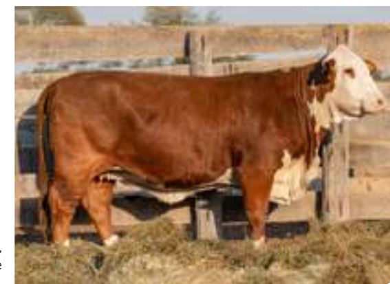
RP R5096, madre de Paiubre.