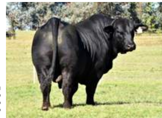
Mustang mostrando su soberbio cuarto posterior.