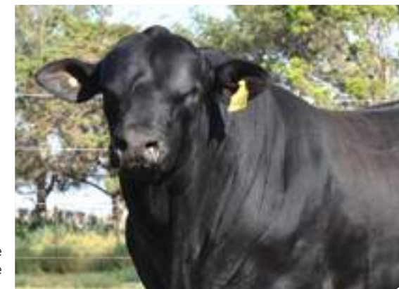
Imponente frente de Cerro Negro.