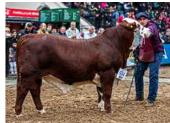
RP 1797 Campeón Ternero Palermo 2017, hijo de Orán.