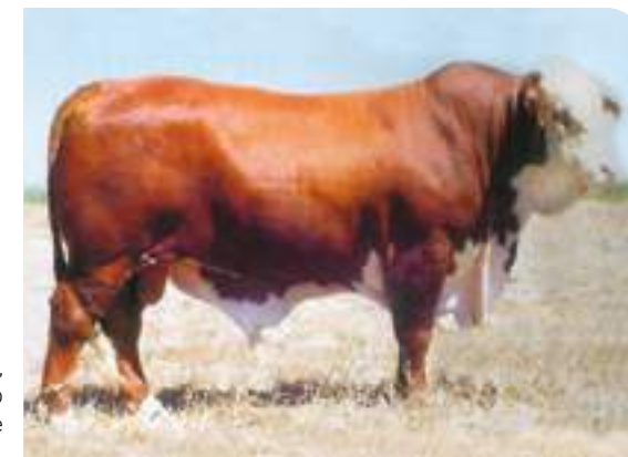
Light Foot, abuelo paterno de Juramento.