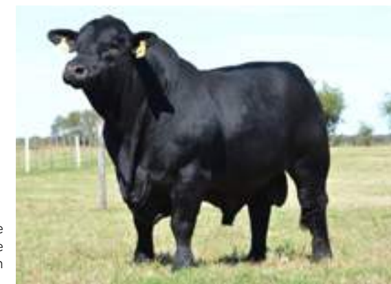
Impactante actitud de padre en Mahuida.