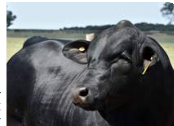
Clase y calidad racial de sobra en su cabeza, año 2020.