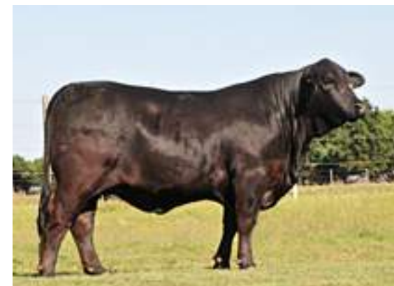
Hija de Tsonga, donante actual de la cabaña.