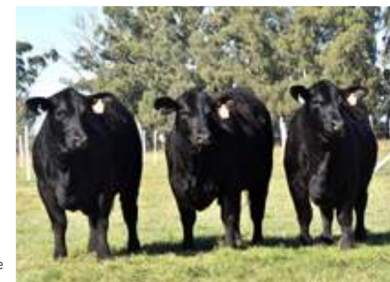
Hijas de Carandá.