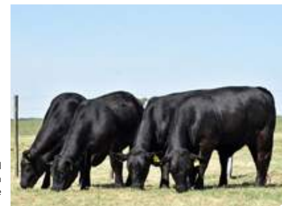
Uniformidad y calidad en estas hijas de Payanquén.