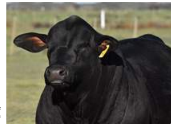
Impactante ancho con mucha carne.