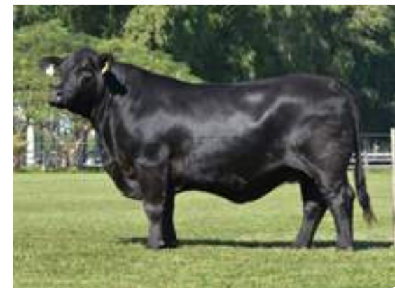
Hija de Tsonga, RP 10592. Donante actual de Gran. Arandú S.A. (PY).