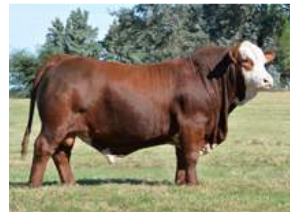
RP 2751 Chaltú uno de nuestros mejores hijos de Metán.