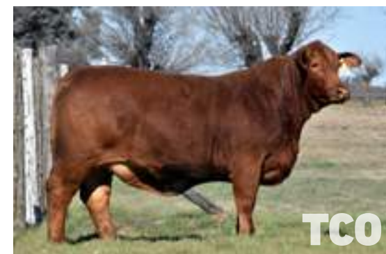
RP 13300, hija de Tabasco.